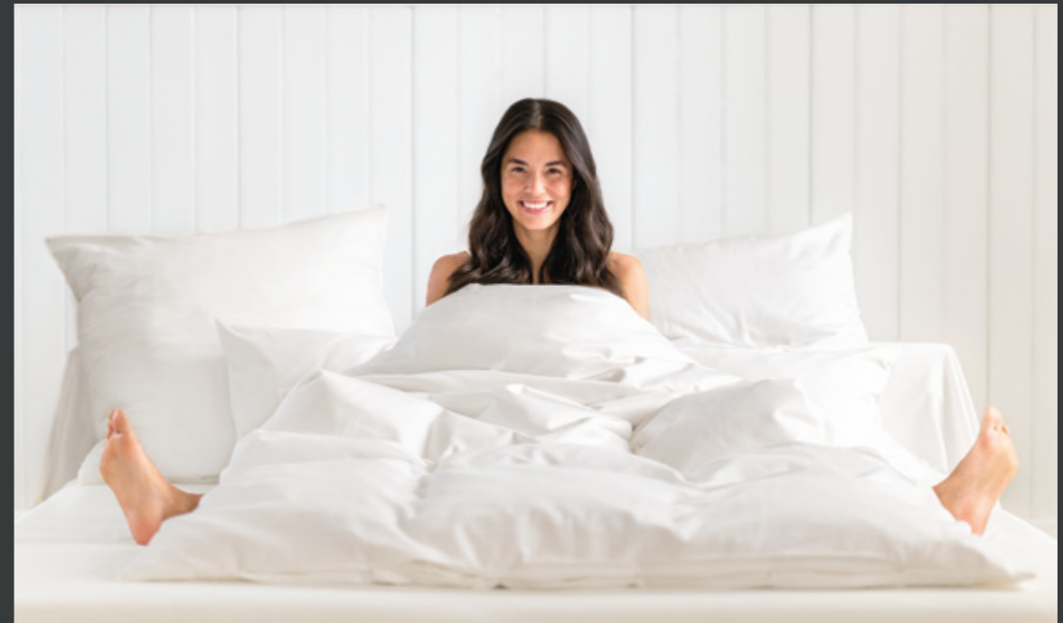
Dass Sie sich in Ihrer Bettwäsche rundum wohlfühlen können, ist unser tägliches Bestreben.

Mehr als 165 Jahre Erfahrung mit Baumwolle