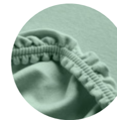
Doppeljersey i196 - Celadon