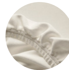
Doppeljersey 001 - Natur

Kombinationsmöglichkeiten mit folgenden Bio-Spannbettlaken