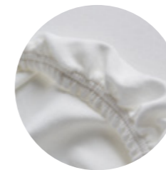
Doppeljersey 003 - Weiß 1