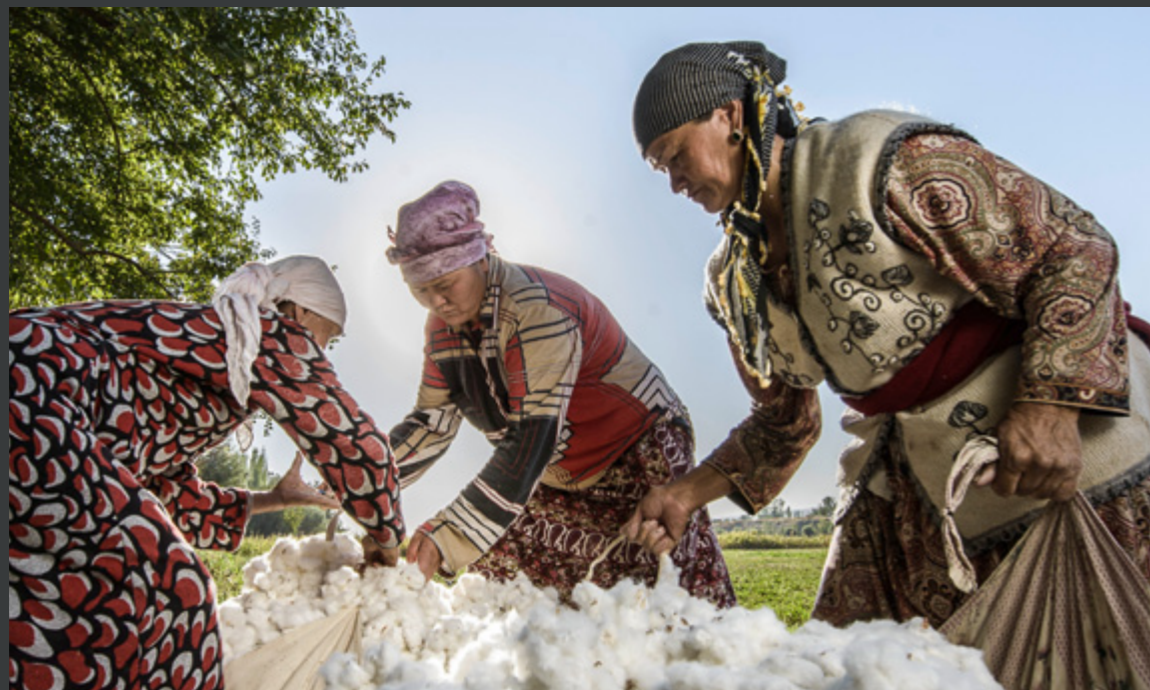
Kirgisische Frauen bei der Bio-Ernte

Volle Transparenz Kontrolle der gesamten Produktion & Lieferkette: vom Anbau bis Zuhause. Fertigung in Europa.