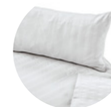
Weiß 1 003