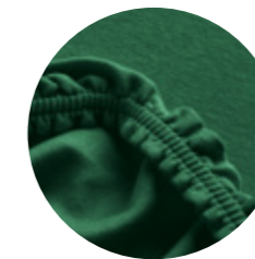
Doppeljersey i194 - Smaragd